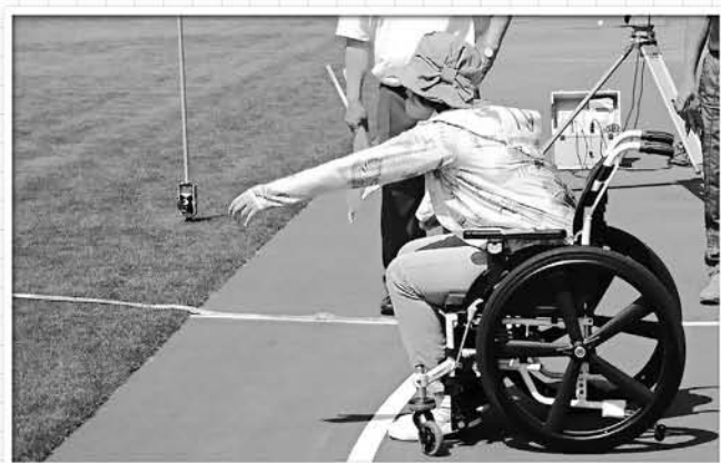
(ビーンバック投げ)