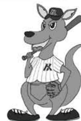
※予定・試合結果・選手紹介はホームページをご覧ください。

5/20.21に山口市で行われた中国都市対抗軟式野球大会において養和会野球部は初戦突破したものの次戦で力及ばず敗戦となりました。この敗戦で得た教訓を練習で活かし更なるレベルアップを図って夏に向けて準備を整えて試合に望みます! この夏も養和会野球部の応援よろしくをお願いします!